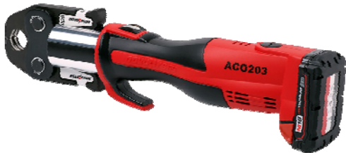
Figure 2 - Sertisseuses compatibles pour le VSH PowerPress