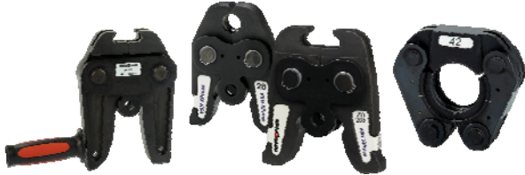
Figure 3 - Mâchoires et anneaux de sertissage

Les mâchoires et les anneaux de sertissage marqués « VSH » sont préconisés et illustrés en Figure 3. Les mâchoires et les anneaux de sertissage comportent également l'indication du diamètre.