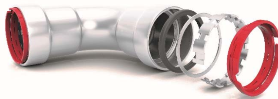
Figure 1 - Schéma du raccord

La gamme détaillée des raccords et leurs cotes d'encombrement sont précisées dans la documentation du fabricant. Cette gamme comporte notamment coudes, tés, manchons, réductions, manchons union à joint plat ou conique et raccords mixtes mâles ou femelles. Le schéma du raccord est illustré en Figure 1.